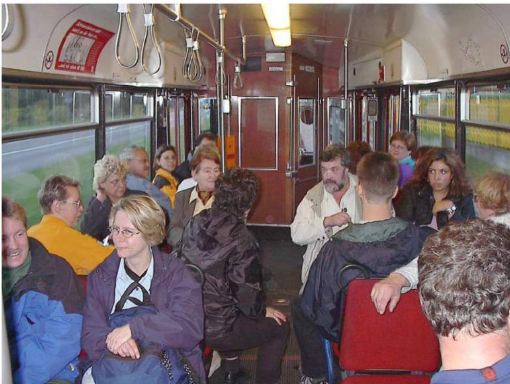
Lustiger Ausklang auf dem Heimweg in der Straßenbahn