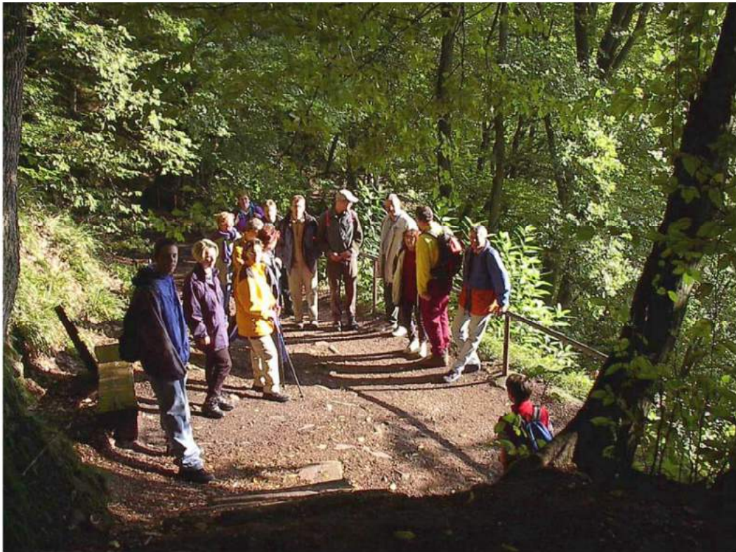
(Noch) entspannte TTC-Wanderer im idyllischen Neckarsteinach...