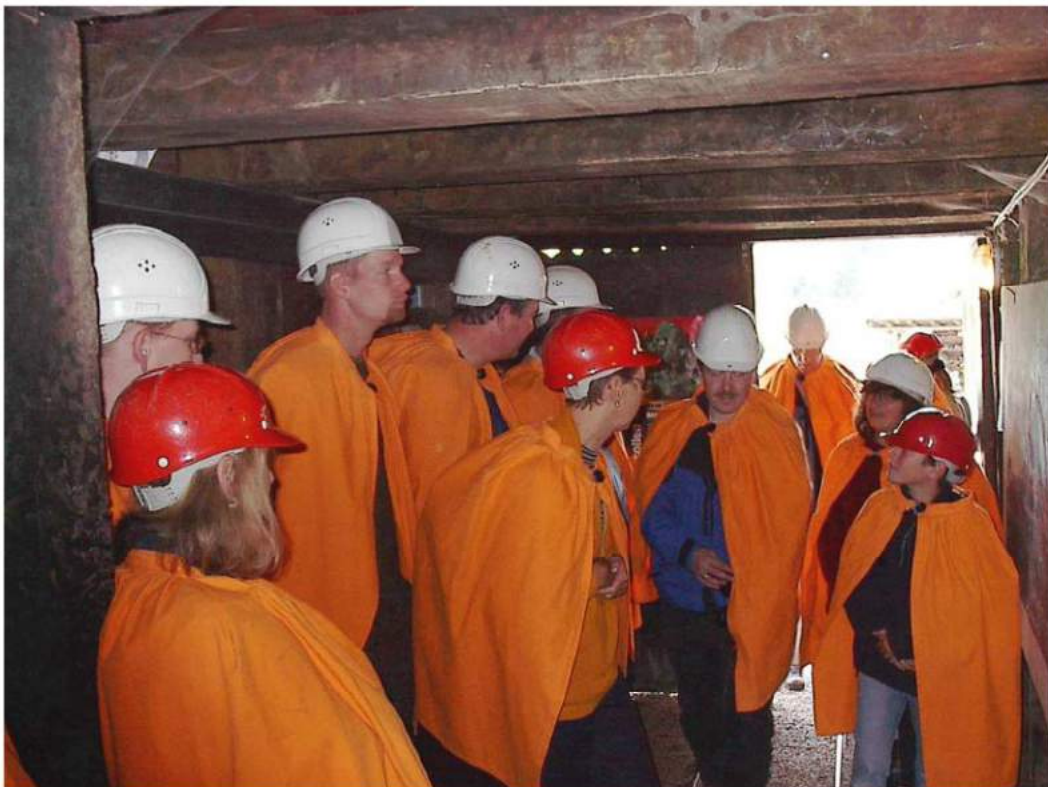
...im Silberbergwerk Schriesheim: interessant, aber die Beine sind schwer...