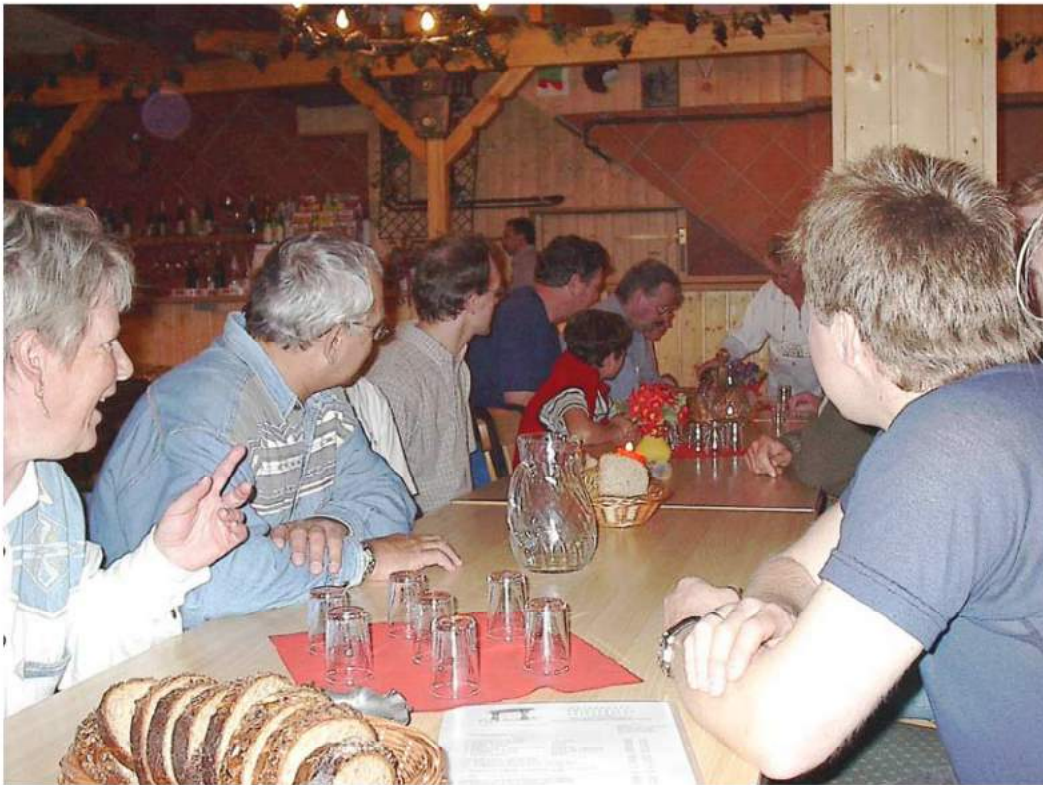
Endlich Pause bei einer Weinprobe im Weingut „Wehweck“ in Schriesheim